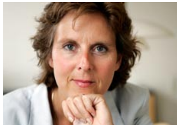
Miljøminister Connie Hedegaard.

Oversigten udgør et øjebliksbillede af de planlægningsmæssige vilkår, som de tager sig ud her ved indgangen til den nye tid, men udviklingen har fart på, og der stilles stigende krav til